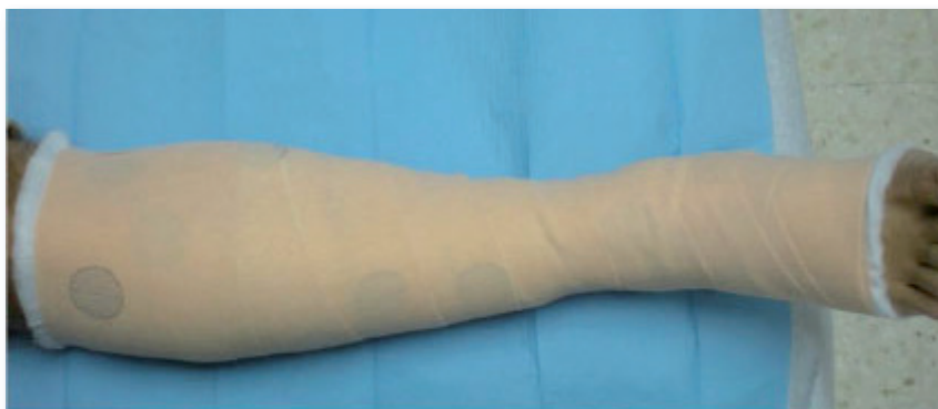
Imaxe 4: Vendaxe de compresión bicapa.

En combinación coa vendaxe multicapa, nas úlceras venosas non complicadas recoméndase como apósito primario un apósito sinxelo, de baixa adherencia, económico e aceptable polo paciente [R] 3 . Unha revisión Cochrane conclúe que o tipo de apósito aplicado debaixo da compresión non demostrou afectar á cicatrización das úlceras 20 .