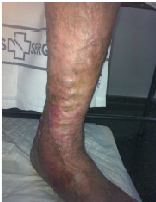
Imaxe 2: Insuficiencia venosa crónica grao 6 da CEAP. Úlcera venosa.