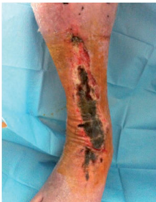
Imaxe 5. Isquemia crítica da extremidade inferior. Úlcera isquémica