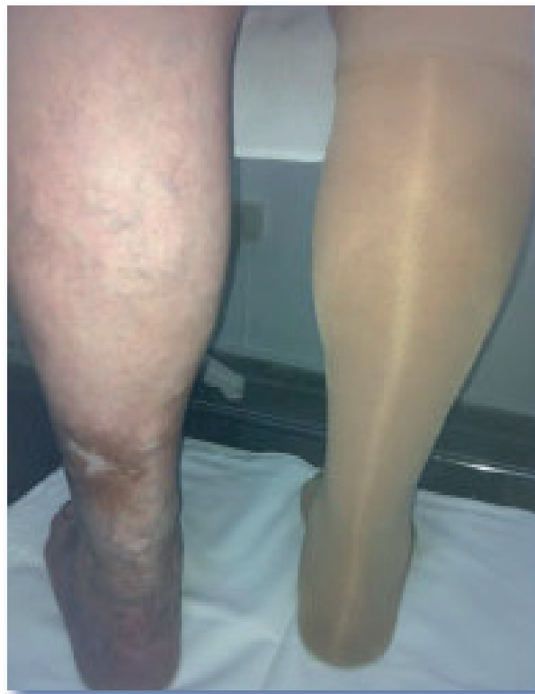
Imaxe 3. Media de compresión decrecente en paciente con IVC