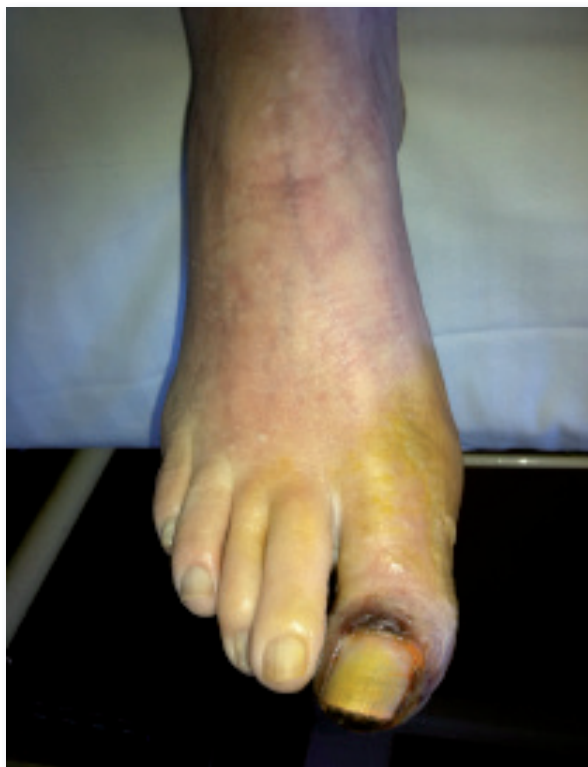
Imaxe 6. Isquemia crónica grao IV da Fontaine.

Inclúense neste capítulo aquelas úlceras relacionadas coa arteriopatía obstrutiva crónica nas súas fases avanzadas (isquemia crítica da extremidade) segundo a clasificación de Rutherford (graos 4, 5 ou 6) e a máis empregada no noso medio, a clasificación de La Fontaine (graos III e IV) 17,24 ( imaxe 6 ).