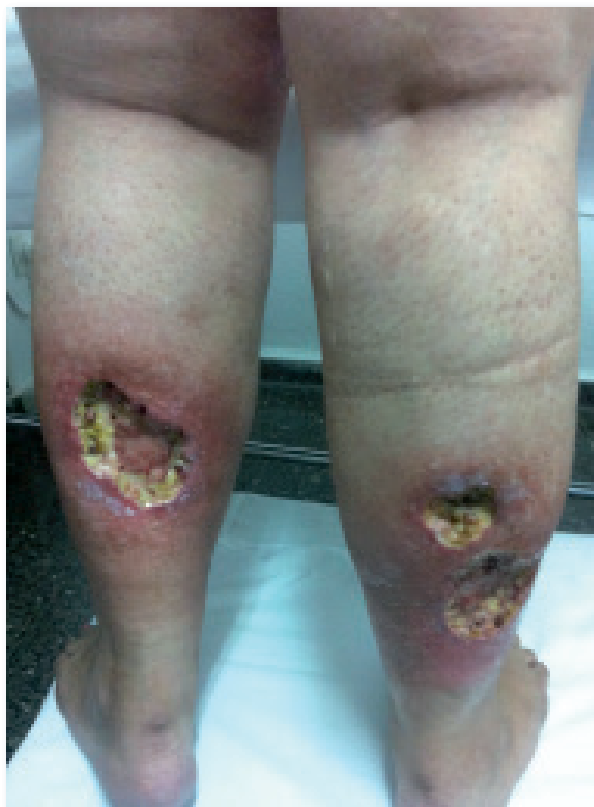
Imaxe 1: Úlceras por alteración metabólica conxénita: déficit de prolidasa.