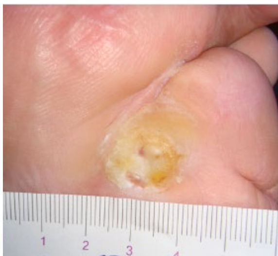
Figura 1. Úlcera grao 0