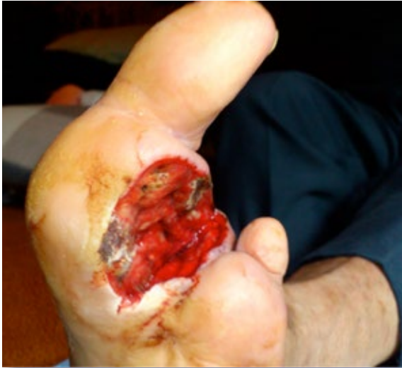
Figura 7. Amputación do segundo dedo do pé