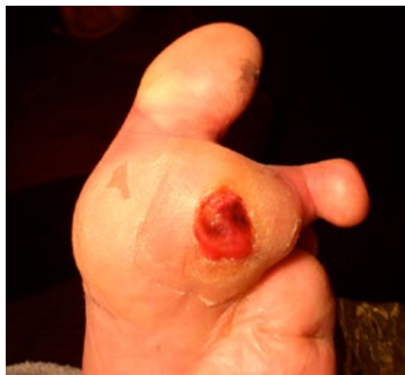
Figura 2. Úlcera grao 1