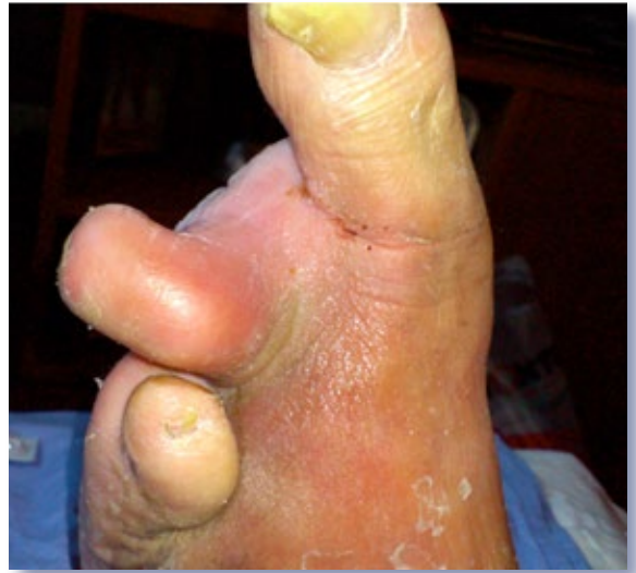
Figura 6. Signos de infección no segundo dedo do pé