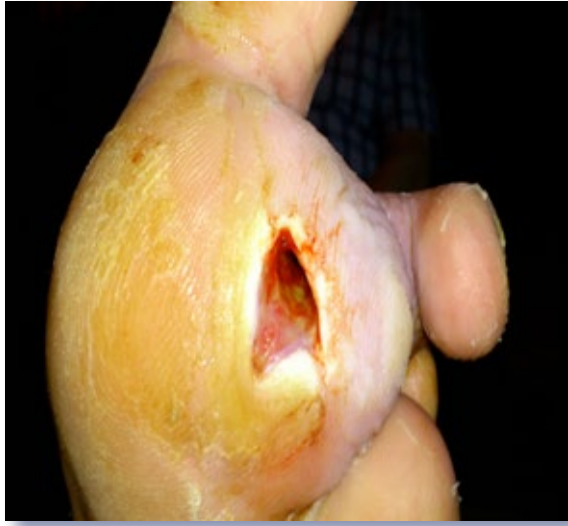
Figura 5. Úlcera con signos de infección