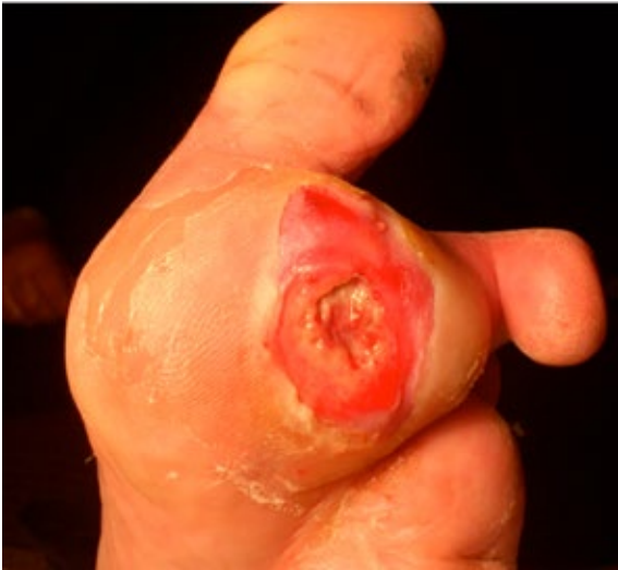
Figura 3. Úlcera grao 2