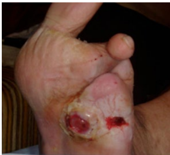
Figura 8. Úlcera neuropática en pé diabético