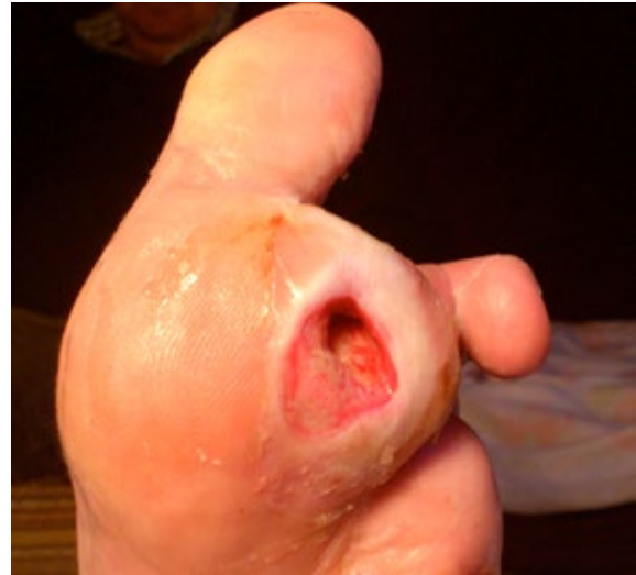
Figura 4. Úlcera grao 3

Conforme as lesións son de grao superior, aumenta a posibilidade de sufrir unha amputación maior e aumenta, así mesmo, a mortalidade asociada. As principais limitacións desta escala serían: